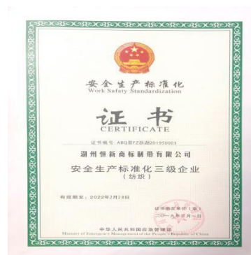
安全标准化三级证书