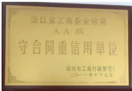
守合同重信用证书

成长和发展对员工来说是至关重要的。公司重视人才引进、培养，为员工提供职业生涯规划，组织各类企业培训，以提升员工素质，2022 年度，公司共投入培训经费 20 多万元，培训 30 多人次，人均培训课时达 35 小时以上。本着“人岗匹配，人尽其才”的基本原则，形成了管理和专业两种职业发展通道，给予员工职业发展方向的选择权，保证公司人力资源优化配置为员工创造良好的晋升渠道，实现员工与企业的共同成长。