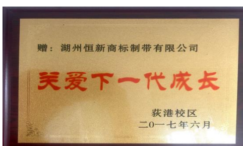
关爱下一代成长捐赠证书

公司坚持“以人为本”，定期召开员工代表座谈会，及时解决员工关心问题；保障员工薪酬增长，持续为员工改善伙食；逐步降低一线员工劳动强度，员工奖惩公开透明，遏制不公；对困难员工给予温暖和人性关怀，如发放困难补助，增强员工对公司认同感和归宿感。