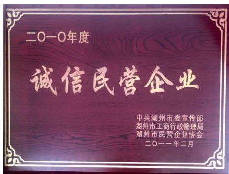
诚信民营企业证书